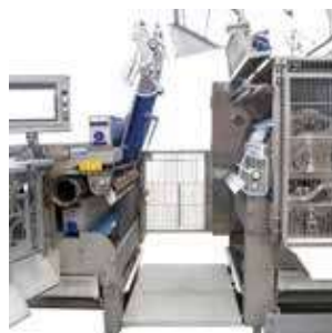
▲ Delený stroj: Je možný prechod celým strojom