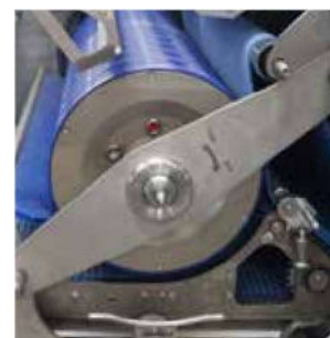
▲ Vymeniteľný vnútorný a vonkajší zakružovací bubon