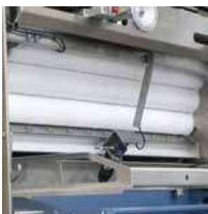
▲ Valcový vťahujúci lievnik rozobratelný bez náradia