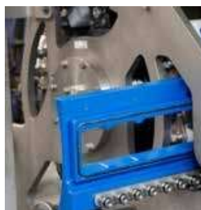
▲ Bubnové lišty a tesniace sklá sa dajú odstrániť bez náradia