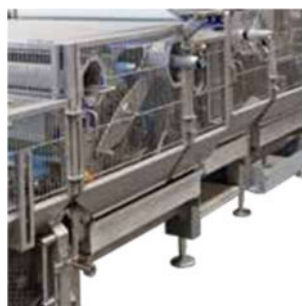
▲ Šikmé plochy a veľkorysá svetlá výška zabraňuje usadzovaniu