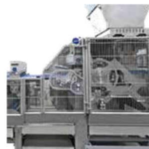
▲ Plne viditeľné kroky výrobného procesu